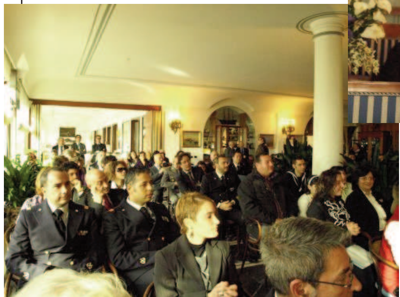
Vista della Sala