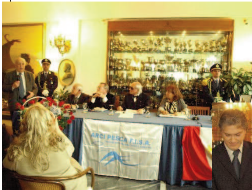
Presidenza e intervento del Gen. Jucci